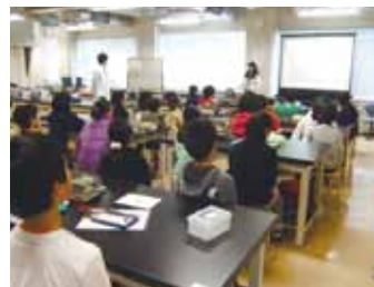
千歳小緑小実験教室2