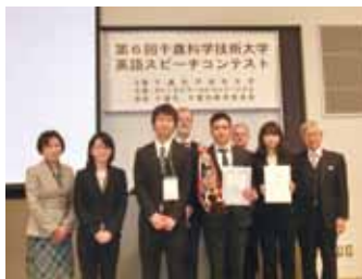
オープン集合写真

今年度は、オープン・ディビジョン3名、ハイスクール・ディビジョン20名の方々にご参加いただきました。内容的にも非常に良いスピーチが多い熱戦となり、審査が例年以上に難しい大会でしたが、盛況のうちにコンテストを終了しました。