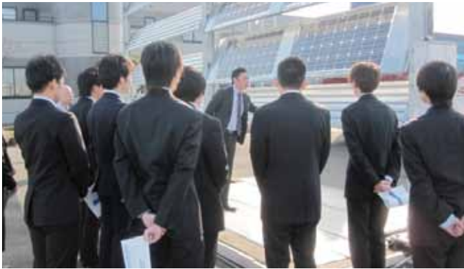
理研興業(株) 見学の様子

各コース参加者からは、「将来社会で働くことへの意識を高めることができた」という声が聞かれました。