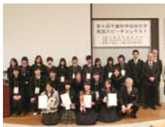
ハイスクール集合写真

開催日時 平成27年2月14日(土) オープン・ディビジョン 10:00~ ハイスクール・ディビジョン 13:00~