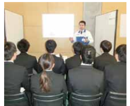
2月 業界研究セミナーの様子

平成27年2月9日(月)から13日(金)の祝日を除く4日間の日程で、本学体育館にて学内業界研究セミナーを開催し、期間中107社の企業にご参加いただきました。本セミナーは、キャリア教育の一環として、希望業界・仕事について学生自身が研究し、これから迎える就職活動に向け、ミスマッチがおきないよう業界・仕事への理解を深めることを目的として今年度初めて実施しました。参加対象は、学部2・3年生及び進学予定の4年生と大学院1年生とし、幅広い学年を対象としました。特に、学部2年生については「キャリア形成B2」の授業科目で、本セミナーの受講を必修として位置付け、参加前に自分の興味のある企業について、会社概要、OB就職状況、なぜこの企業に興味を持ったのか、この企業に入社するとした場合の自己PR等についてレポートを提出させ、期間中最低5社の説明を聞き、自分の考えていたものを検証するとともに、幅広い業界について研究する良い機会となりました。