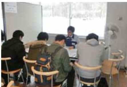
OB・OGの話を聴く学生

今回は、13社14名のOB・OGの方々にご協力いただき、参加した学生からは、「大学で学ぶことと、働く際に必要な知識の違いを知ることができた」、「希望業界の企業に就職するためのプロセスについてお話が聞けた」、「ただ内定を得るのではなく、入社してから長期的に取り組める仕事を探そうと思った」など、進路を見据えた姿勢で参加していた様子が伺えました。