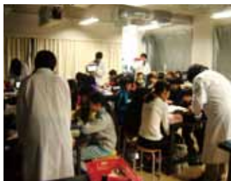
千歳小緑小実験教室1

2月13日(金) 千歳市立千歳小学校 5年1組、2組 2月24日(火) 千歳市立緑小学校 5年1組、2組