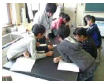
理科実験授業の様子2