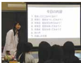
理科実験授業の様子1

11月11日(火)、14日(金)、18日(火)、21日(金) 千歳市立千歳小学校 6年1組、2組 12月2日(火) 千歳市立緑小学校 6年1組、2組