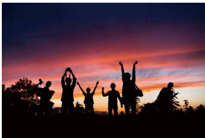
受賞作品「夏の思い出」