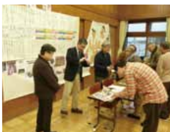
ひとまちネット展示