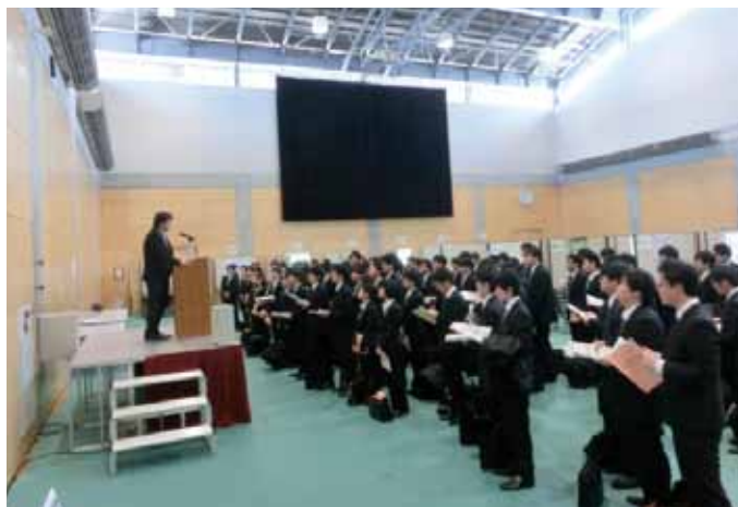
3月 参加企業によるPRタイムの様子

平成27年3月17日(火)から24日(火)の土日を除く平日6日間の日程で、本学体育館にて学内企業研究セミナーを開催しました。本セミナーは、学部3年生と大学院1年生を対象としており、今年は企業の採用意欲も非常に高く、期間中182社の企業にご参加いただきました。例年、本セミナーは2月に実施しておりましたが、2016卒採用から就職活動が後ろ倒しになったこともあり、時期を遅らせての開催となりました。連日多数のリクルートスーツ姿の学生が企業の話に真剣に聞き入っていました。