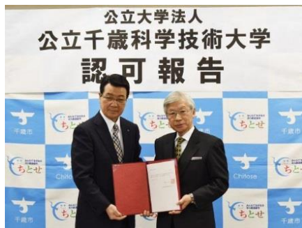
山口市長（左）と川瀬学長

1 月 31 日（金）公立大学法人公立千歳科学技術大学の認可に係る記者会見が開催されました。